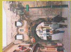
om schiedingen vorkstouwen

Nog even doorblijven en u bent weer op de plek waar u bent begonnen: het mooie Heijenraath. Vergeet niet te vertellen wat u van de tocht vindt!